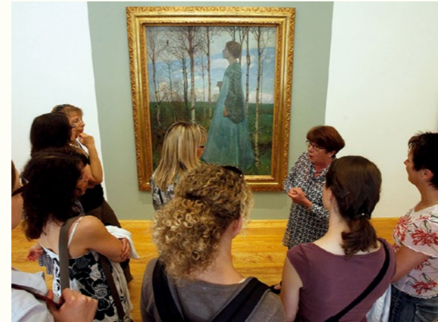
Führung vor dem „Frühling“ von Heinrich Vogeler.

Hier finden Sie auch detaillierte Informationen zum gesamten Führungsangebot und zu den einzelnen Gästeführern.