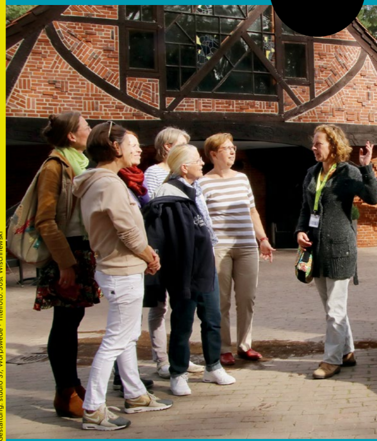
Gestaltung: studio 37, Worpswede