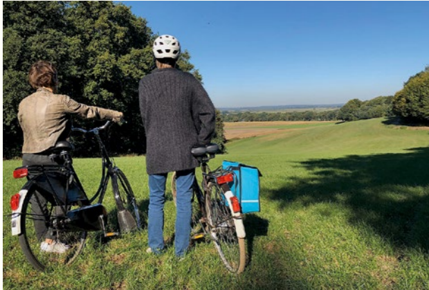
Führung mit dem Fahrrad auf dem Weyerberg.